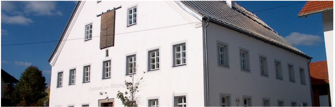
_ Infostelle "Würzinger Haus" in Außernzell

Der Naturpark Bayerischer Wald e.V. hat im Jahr 2003 zusammen mit der Gemeinde Außernzell und dem Landkreis Deggendorf im Dachgeschoss des Würzingerhauses eine Naturpark-Infostelle für den Landkreis Deggendorf eingerichtet. Die Ausstellung hat die Besonderheiten von Natur und Landschaft am Forchenhügel sowie die Aufgaben des Naturparks Bayerischer Wald e.V. zum Thema.