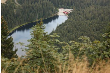
Der Große Arbersee vom Mittagsplatzl aus