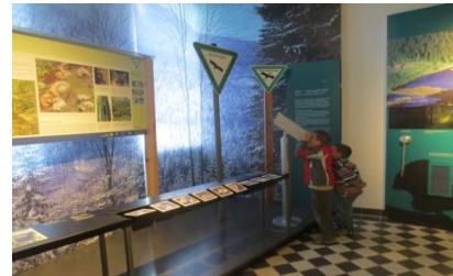
Ausstellung „König Arber“