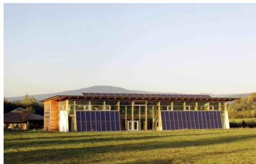
Das Sonnenhaus am „Weisswurstäquator“ (49. Breitengrad)