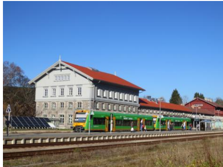
Historischer Grenzbahnhof aus dem Jahr 1877

Erinnerungsfoto an der Deutsch –Tschechischen Grenze (Ausstellung „Kalter Krieg“)