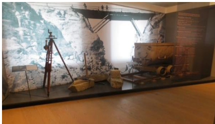
Ausstellung „Höchste Eisenbahn“

verbunden mit einem Streifzug durch die Modelleisenbahn