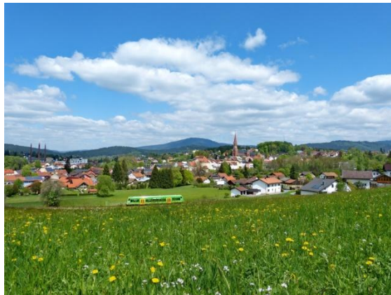
Die Glasstadt Zwiesel

Eintreffen im Hotel, (Zwiesel, Zimmerbezug) 16:00 Uhr