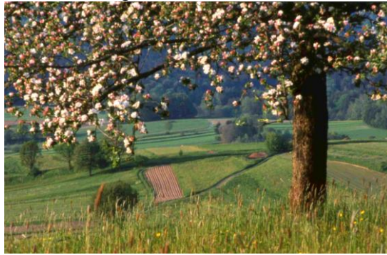
Bäuerliche Kulturlandschaft im Bayer. Wald

Weiterfahrt zum Naturschutzgebiet Todtenau mit Aussichtspunkt (Hochmoorgebiet in der Gde. Kirchberg) 11:00 Uhr