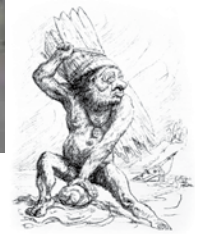
Calliban, 1918, Alfred Kubin © VG Bildkunst, Bonn 2018

Die Kuns(t)räume ...grenzenlos finden sich im historischen Gebäude des ehemaligen Postamtes. Auf über 700 Quadratmetern widmet sich die direkt neben dem Grenzbahnhof gelegene Galerie der Kunst in der Donau-Moldau-Region. Zeitgenössische Kunst hat hier ebenso ihre Heimat wie das Kunstschaffen früherer Generationen. Ein Filmvorführraum sowie ein Shop mit Kunstvollem und Handwerklichem aus der Region runden das Angebot ab.