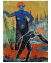
Démon slatě, 1931, Josef Váchal

Alfred Josef Kubin Váchal Der Magier aus Zwickledt