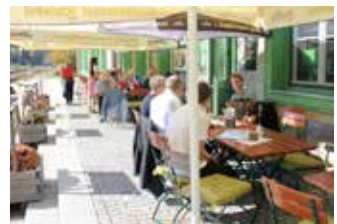
Historischer Wartesaal 1. Klasse mit Naturpark Wirtshaus und Biergarten

Besuchen Sie die NaturparkWelten und das historische Naturpark-Wirtshaus im Grenzbahnhof Bayer. Eisenstein, ausgezeichnet als „Bahnhof des Jahres 2017“