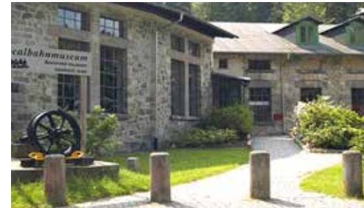
Erweiterter Ausstellungsbereich und neue Drehscheibe im Freigelände!