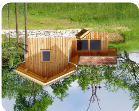
Lehrbienenstand am Obstgarten

Am „Erlebnislehrpfad Kulturlandschaft“ säumen heckenreiche Streuobstwiesen, Weiher, Bachwiesen und knorrige Hangwälder den Weg. Ein Lehrbienenstand im Obstgarten und der Beobachtungsstand an den Weibern bieten vielfältige Möglichkeiten der Naturinformation und Naherholung.