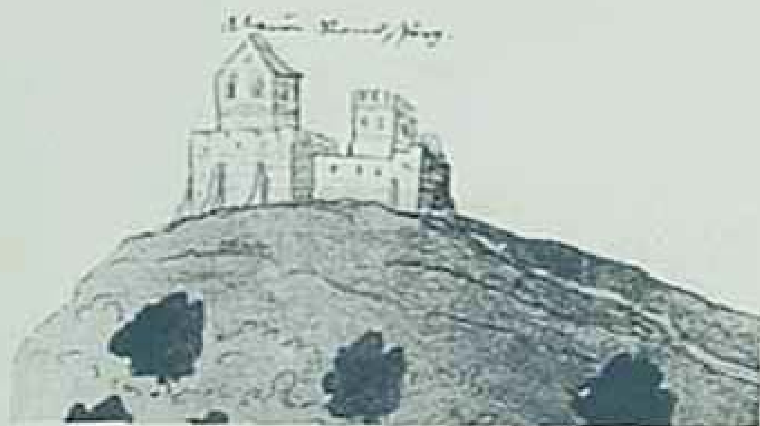
Ansicht aus dem Jahre 1777

Die Burg wurde um 1330 durch Friedrich dem Ramsperger, einen Abkömmling eines auf dem heutigen Altrandsberg ansässigen Adelsgeschlechts, als "Feste Neuenramsberg" erbaut. Um 1450 ging die Burganlage in landesfürstlichen Besitz über und diente lange Zeit als Staatsgefängnis.