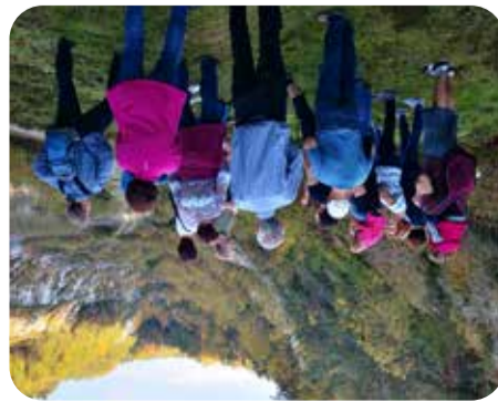
Führung am Steinbruch