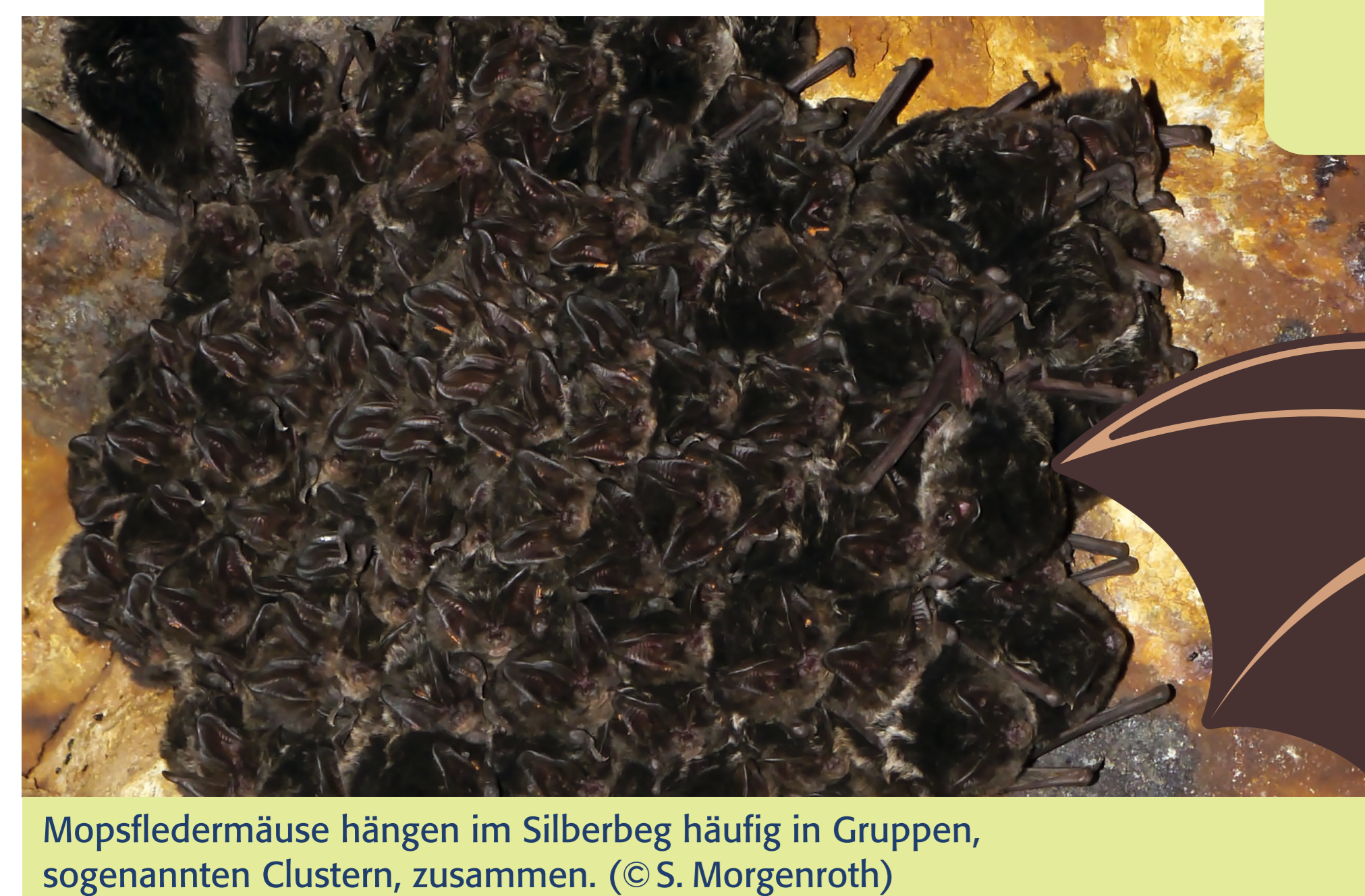
Mopsfledermäuse hängen im Silberberg häufig in Gruppen, sogenannten Clustern, zusammen.

Hallo, ich bin FRANZI FLEDERMAUS . Willst Du dein Fledermauswissen testen? Dann schau Dir die kleinen Klappertafeln hier an.