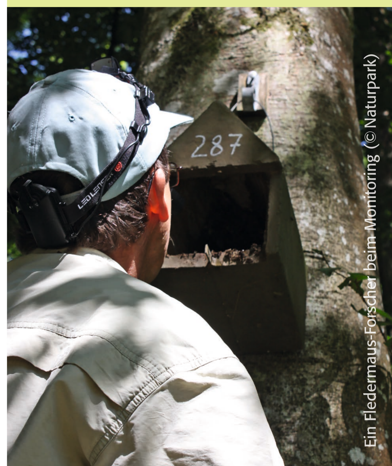
Ein Fledermaus-Forscher beim Monitoring