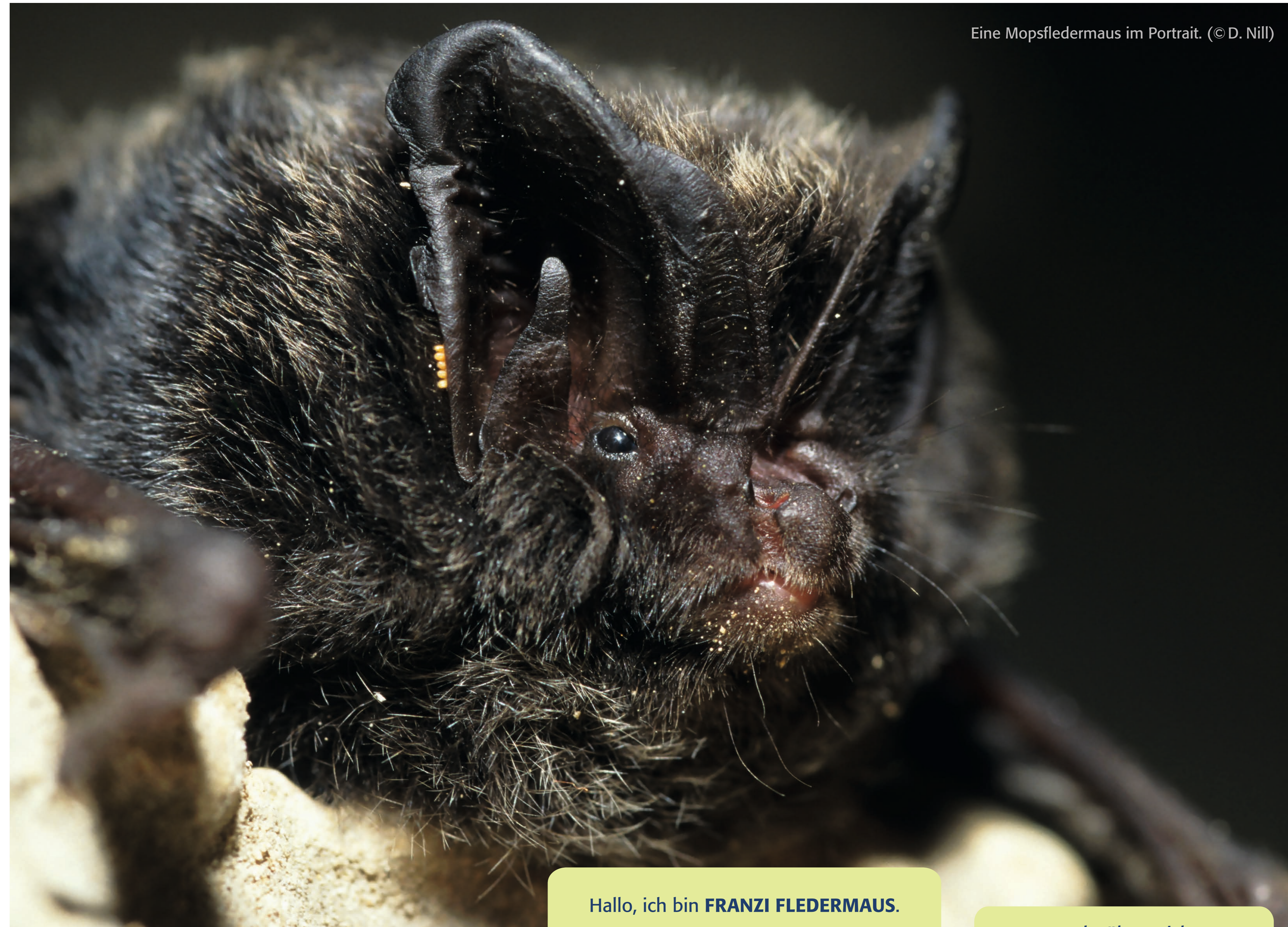
Eine Mopsfledermaus im Portrait.