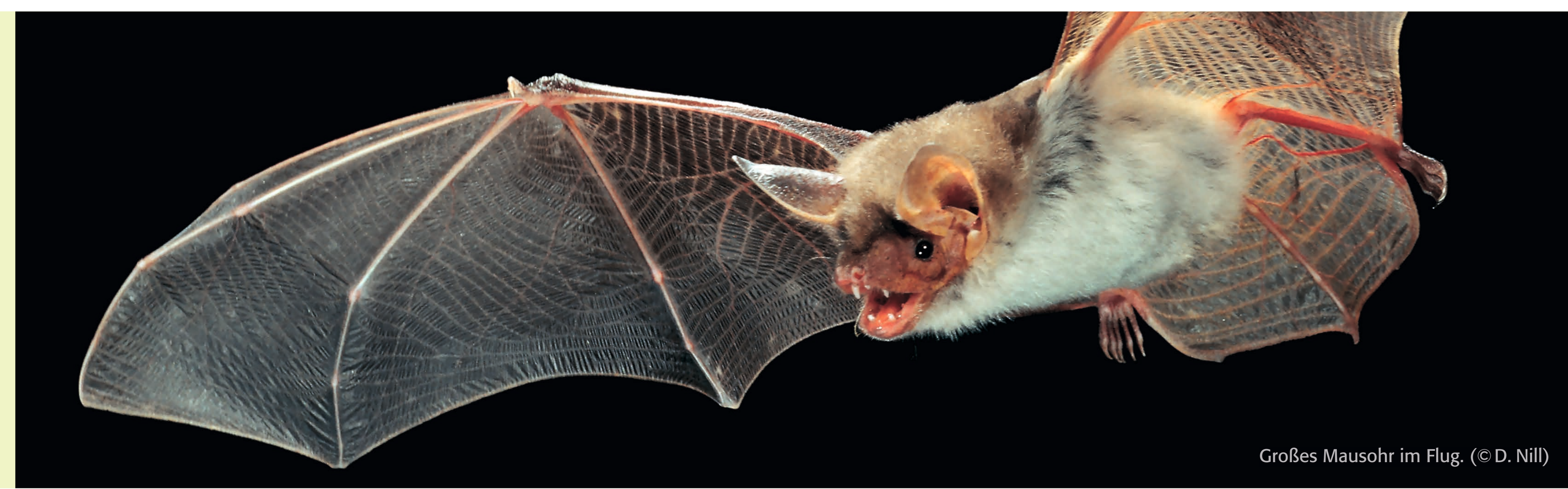
Großes Mausohr im Flug.